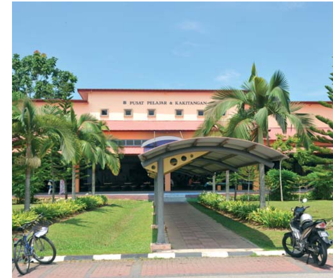
Universität von Sains, Malaysia