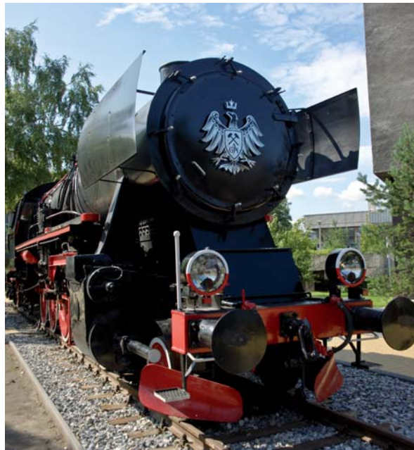
AGH Krakau, Polen