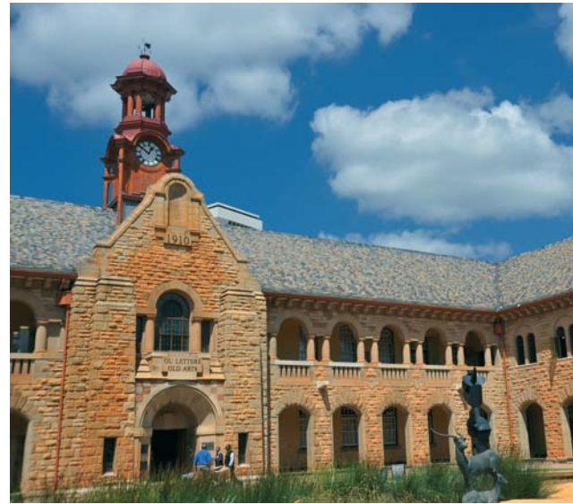
Universität von Pretoria, Südafrika

Grundsätzlich haben Sie als Studierende der TU Clausthal folgende Möglichkeiten, ins Ausland zu gehen: